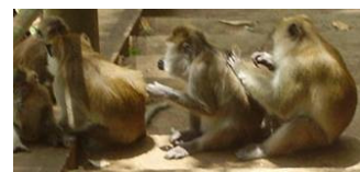
Nasjonale kampanjer bidrar til at det blir lettere for alle å sjekke barna for lus.