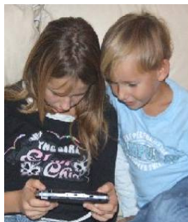
Hode-/hårkontakt er den største smitekilden.

Vi har laget en PowerPoint-presentasjon om hodelus, som kan benyttes til undervisning. Presentasjonen kan lastes ned fra vår nettside.