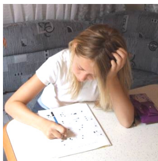
Man kan ha lus uten å kjenne symptomer (kløe).

Vi håper at alle kommuner vil oppfordre foreldre og foresatte til å delta, og at de vil sende denne informasjonen videre til barnehager og skoler i sin kommune.